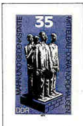
Monumento di Dora-Mittelbau