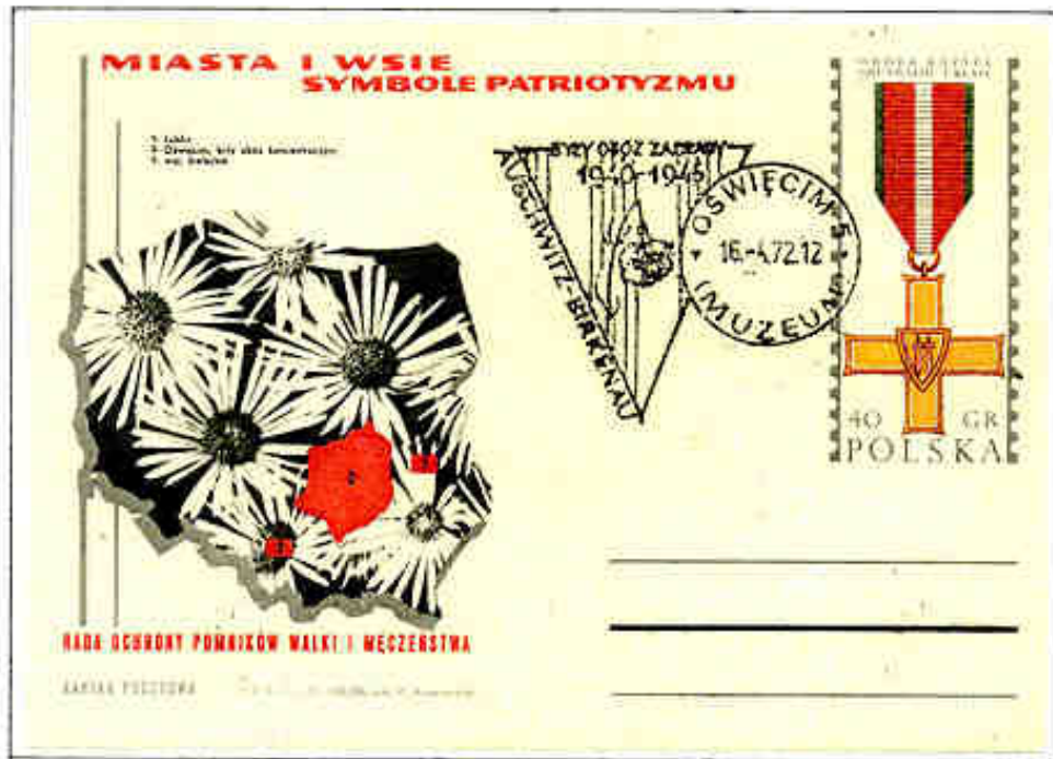
Cartolina illustrata celebrativa del lager di Lublino, Auschwitz e Kieleckie.