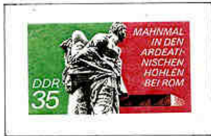
Monumento delle Fosse Ardeatine