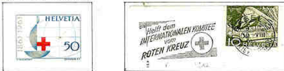
Aiutate il Comitato Internazionale della Croce Rossa!