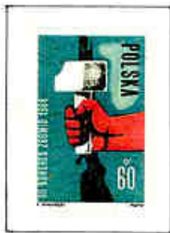
3° Congresso dello ZBoWiD