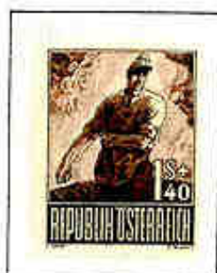
Il ritorno in famiglia e al lavoro.