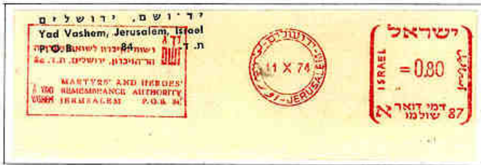
Timbro postale su busta ufficiale dell'Istituto Yad Vashem (Gerusalemme)