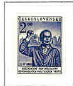
Praga 1945: primo congresso dei prigionieri politici.