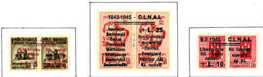
Francobolli soprastampati dal Comitato Liberazione Nazionale Alta Italia (C.L.N.A.I.) a favore dei reduci dai lager.