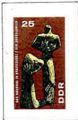
Monumento ai fucilati di Kragujevac