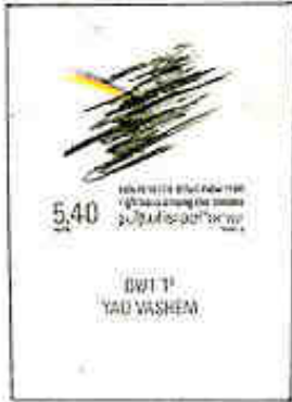
Istituto Yad Vashem per la storia dello Olocausto ebraico