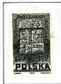
Monumento nel campo di sterminio di Treblinka