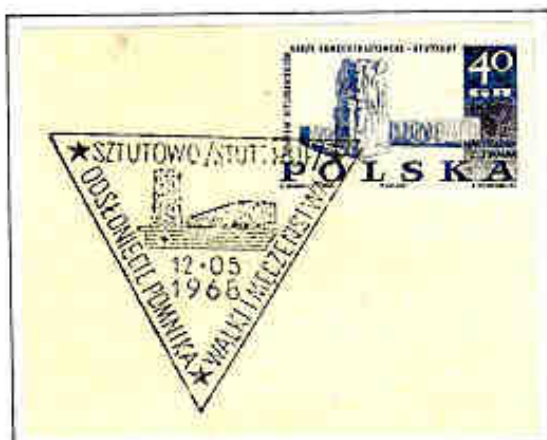
Museo di Stutthof