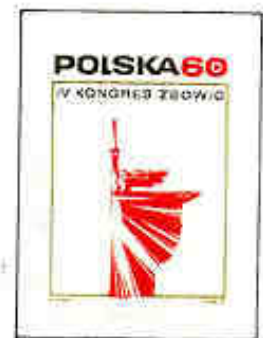
4° Congresso dello ZBoWiD