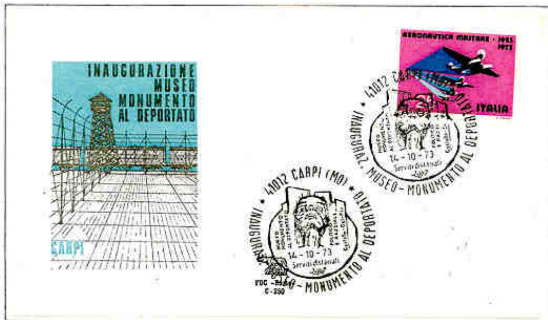
Museo monumento al deportato politico e razziale di Carpi