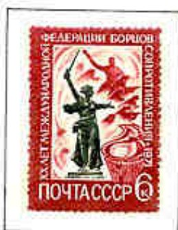
20° anniversario della fondazione