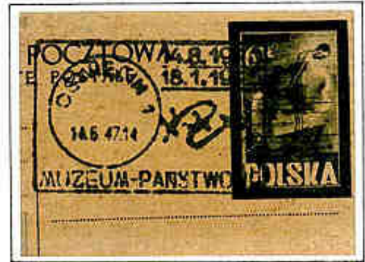
Museo di Auschwitz I e monumento internazionale di Birkenau