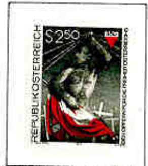
Associazione austriaca della Resistenza e delle vittime del nazismo