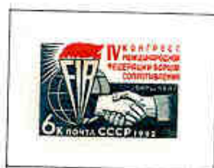
4° Congresso della R.I.R.