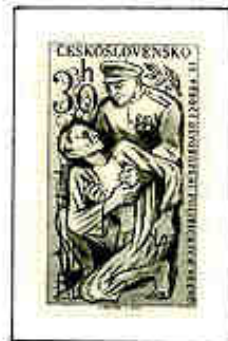
Il 29-4-1945 Dachau non era più un lager nazista!