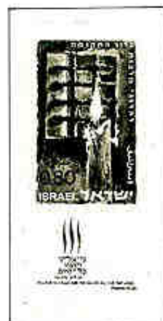
La speranza in un avvenire migliore