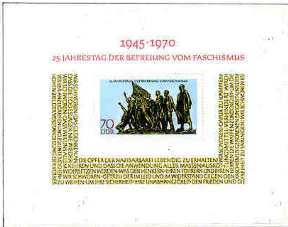
Il giuramento dei deportati (11-4-1954)