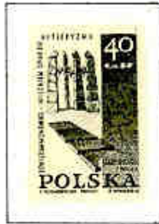
Monumento di Monowitz