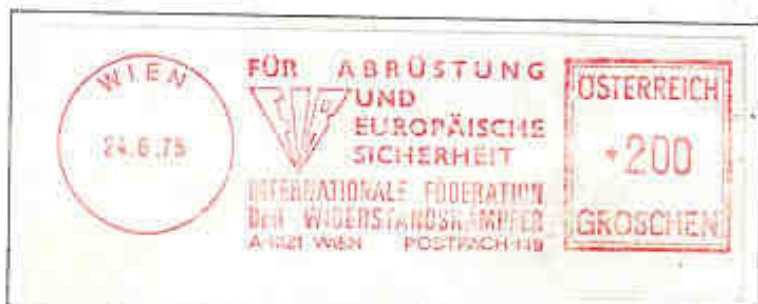
Timbro postale usato nella sede di Vienna della F.I.R.