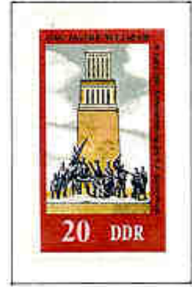
Museo di Buchenwald inaugurato il 14-9-1958