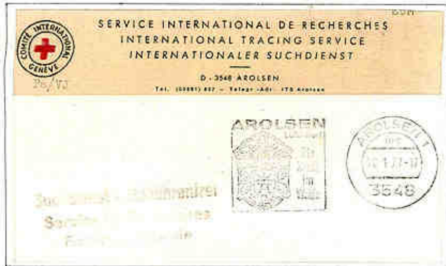
Lettera in franchigia del Servizio Internazionale di Ricerche della Croce Rossa (S.I.R. - Arolsen)