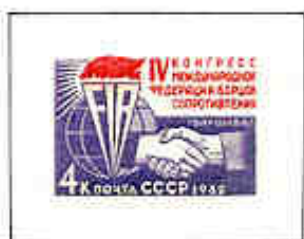
4° Congresso della F.I.R.

La Federazione Internazionale della Resistenza (F.I.R.) raggruppa più di 50 organizzazioni di ex resistenti, vittime del fascismo e del nazismo, sopravvissuti dei lager, di 23 paesi d'Europa e d'Israele.