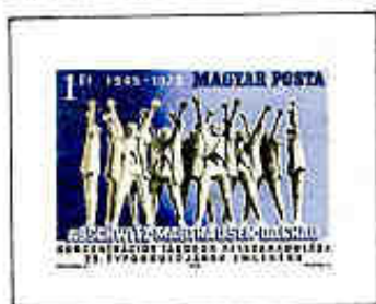
Monumento ai deportati ungheresi di Mauthausen