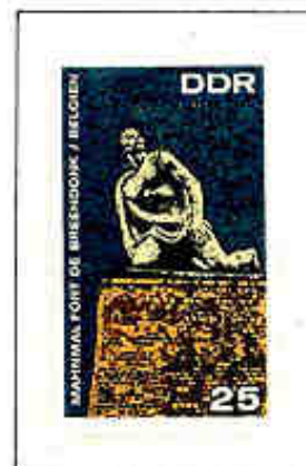
Statua di Ernst Thälmann e monumento nazionale al deportato politico belga del forte di Breendonk.