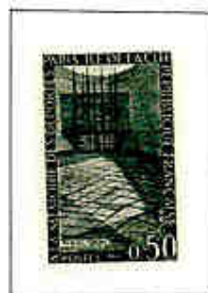
Cripta dei deportati a Parigi.