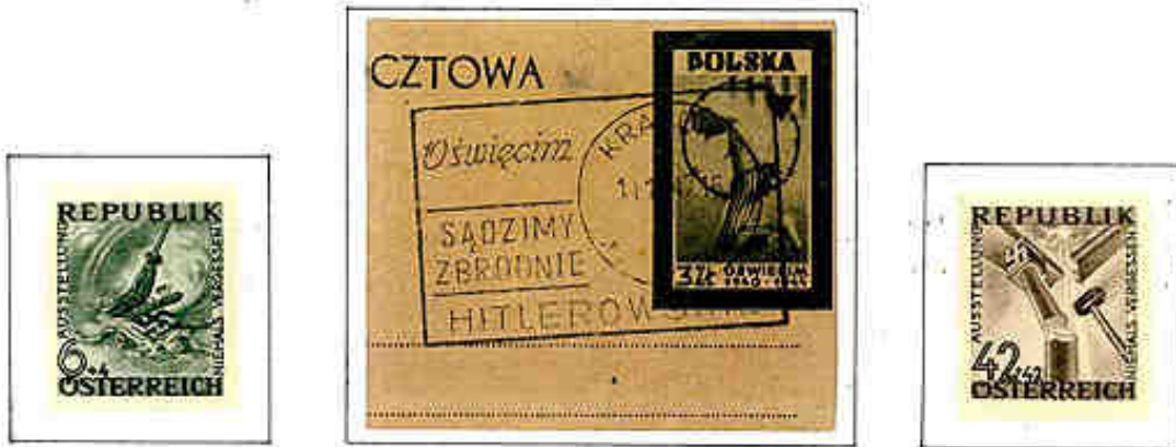
"Condanniamo i criminali nazisti" era scritto sull'annullo polacco del 1947. Fino ad oggi, ben pochi sono stati giudicati e condannati.