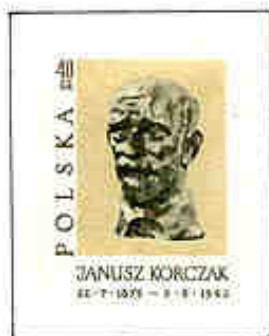
Busto di Janusz Korczak.