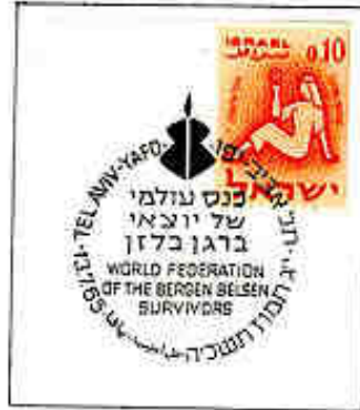
Federazione mondiale dei sopravvissuti di Bergen-Belsen