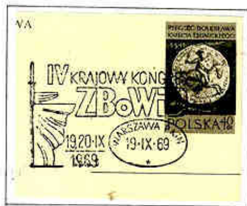
Associazione polacca dei Combattenti per la libertà e la Democrazia (ZBoWiD)