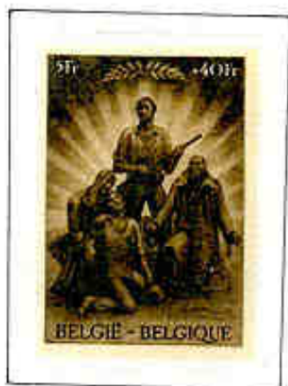
Tutti uniti per la libertà