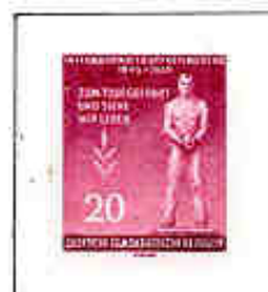
Monumento del cimitero di Brandeburgo s/Havel e del Kommando di Langenstein-Zwieberge.