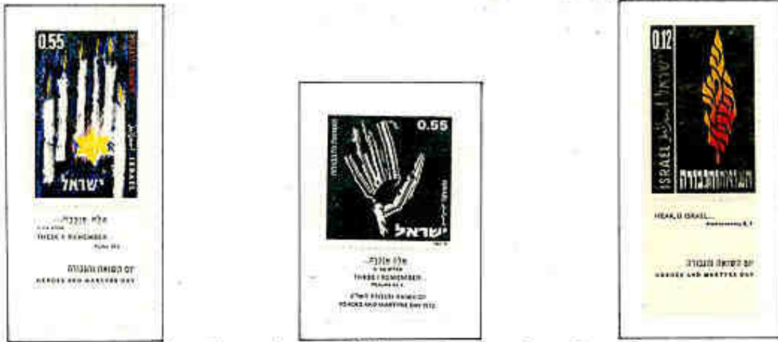
Dimenticare è impossibile e ricordare è un dovere!