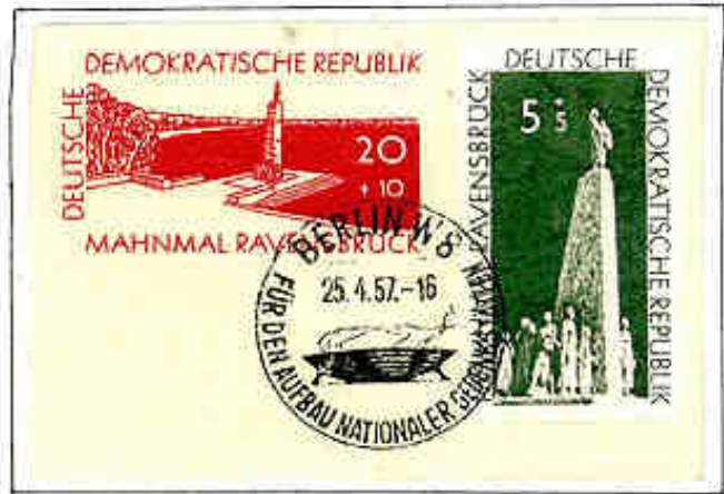
Memoriale di Ravensbrück