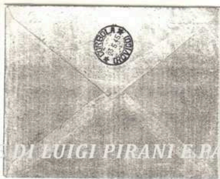
Verso della lettera con timbro di arrivo a Corbola.