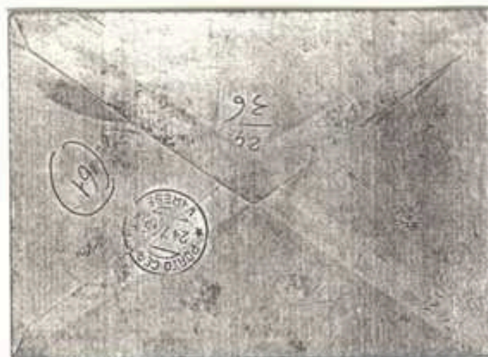
Verso della lettera con timbro di arrivo a Porto Ceresio.