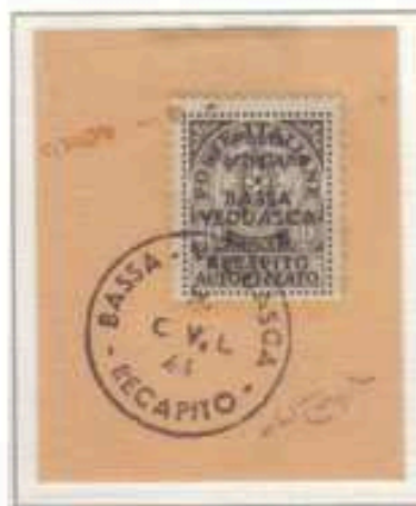
Frammento con annullo CVL

1944 - Recapito autorizzato del 1930 soprastampato a mano in nero e in rosso: "Posta Partigiana Bassa Veddasca" con nuovo valore.