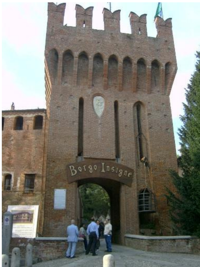
Fig.1 congressisti davanti al Castello

da un articolo della Voce del Cifr del novembre 2007