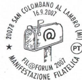
fig.5 annullo della manifestazione