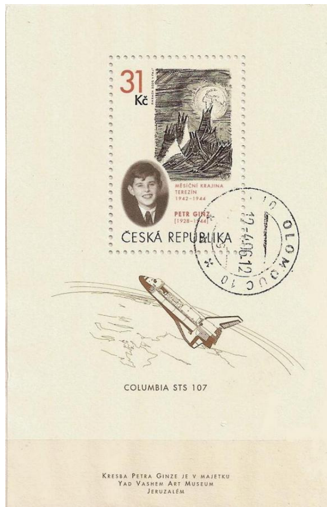
fig.3 foglietto della repubblica Ceca su P. Ginz

L'emissione non è dedicata solamente a Petr Ginz. Nella parte inferiore del foglietto è riprodotta l'immagine della navicella spaziale Columbia, disintegratasi nel viaggio di rientro sulla Terra, dopo il compimento della missione nello spazio, il 1° Febbraio 2003, con la morte dei sette membri dell'equipaggio. Dell'equipaggio faceva parte, su invito della NASA, un astronauta israeliano, il colonnello dell'aeronautica militare Ilia Ramon. Ogni astronauta impegnato nelle missioni spaziali statunitensi, ha il permesso di portare con sé alcuni oggetti personali. Ilan Ramon (Alef Yud Lamed Nun), la cui madre era sopravvissuta ad Auschwitz, desiderava portare nello spazio un oggetto significativo che ricordasse l'Olocausto. Il Museo Yad Vashem, al quale egli si era rivolto, gli propose uno dei disegni realizzati nel ghetto di Terezin da Petr Ginz, un disegno particolarmente attinente ad una missione spaziale. Il disegno scelto, realizzato a matita su carta, fu questo: