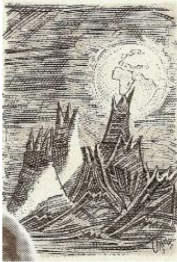
Fig.4 disegno della vista dalla luna