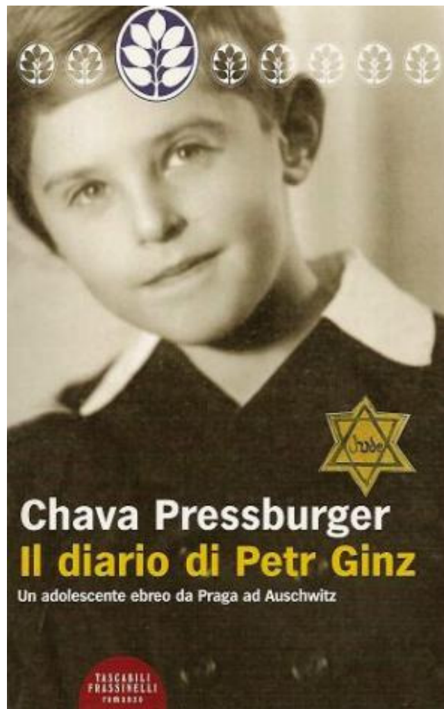
fig.1 copertina del libro "Il diario di Petr Ginz"