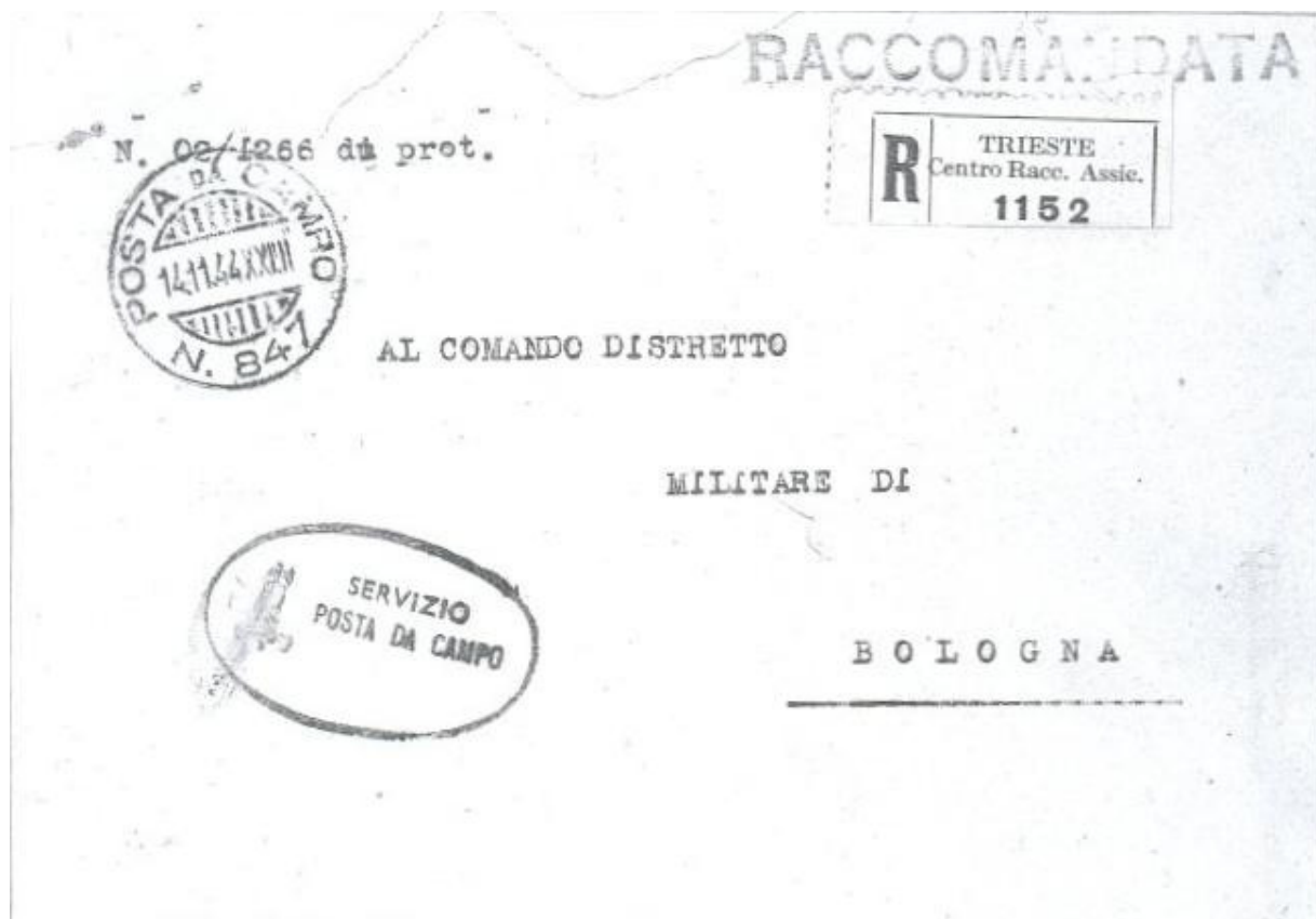
Fig.7 – Lettera in franchigia da “Posta da Campo n. 847” (Trieste) 14.11.44 a Bologna, con ovale di franchigia “Servizio Posta da Campo”.