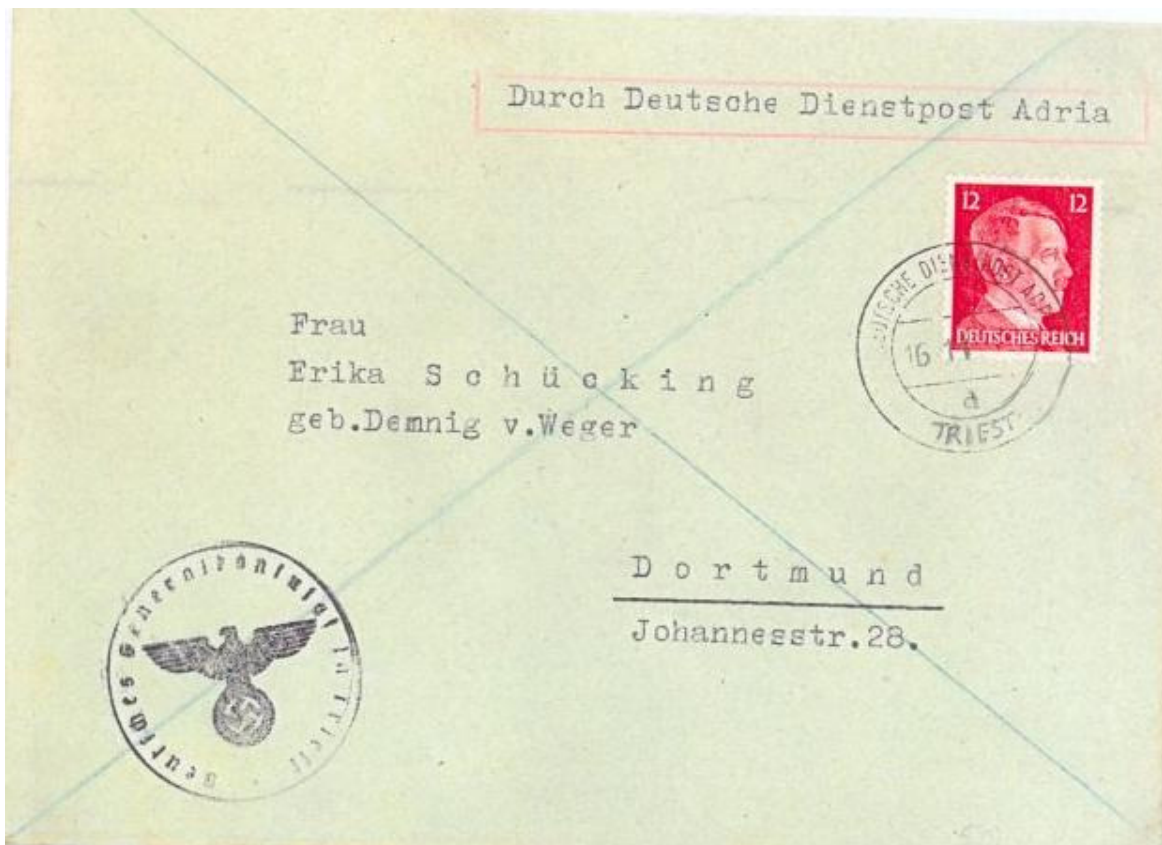
Fig.6 -Lettera per la Germania da “Deutsche Dienstpost Adria – Triest a – 16.11.44 a Dortmund, affrancata con francobollo da 12 p. , con brefstempel del Consolato Generale germanico di Trieste.

Le buste e le cartoline inoltrate via “Dienstpost”, sul frontespizio, dovevano portarne l’identificazione apposta in cartella rossa (es.: “Durch Deutsche Dienstpost Adria – Triest”) e venivano completamente contrassegnate da una croce di Sant’Andrea tracciata con matita blu.