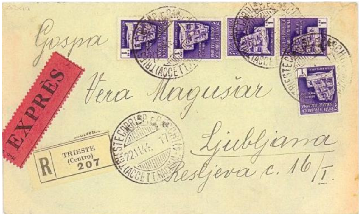
Fig.1 - Lettera raccomandata espresso da Trieste 22-11-44 per Lubiana, affrancata con RSI monumenti distrutti 1 lira x cinque

previo benessere del Gauleiter, e tedeschi furono sia il comando degli organi di polizia fascisti che l'effettuazione della leva militare; venne anche proibita l'esposizione della bandiera italiana repubblicana. Questa fu dunque la situazione di Trieste, ove per l'importanza della città le conseguenze e le restrizioni furono particolarmente gravi e pesanti per la cittadinanza. Per quanto riguarda il servizio postale fu operativa una doppia organizzazione il che rende questo periodo di particolare interesse per i collezionisti di storia postale moderna. Gli uffici postali italiani continuarono a svolgere la loro normale attività per la corrispondenza degli utenti civili, sia diretta all'interno della R.S.I. che all'estero, corrispondenza affrancata coi francobolli e secondo le tariffe in corso nella repubblica fascista (fig. 1 e 2).