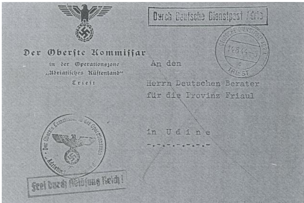
Fig. 3 -Rara lettera in franchigia con intestazione e briefstempel del Commissario Supremo della Operationszonen di Adria, da “Deutsche Dienstpost Adria – Triest c – 14.8.44” per Udine, indirizzata al Consigliere germanico della Provincia del Friuli