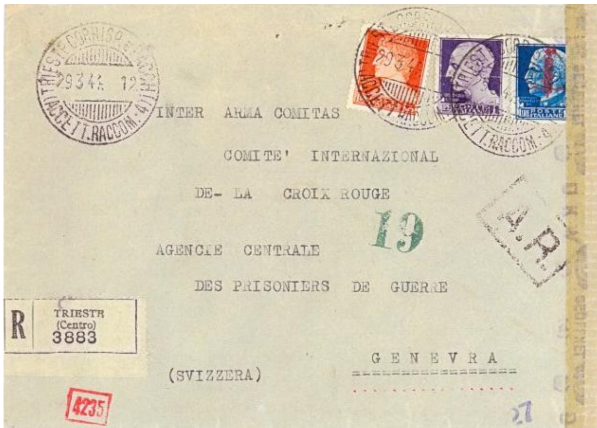
Fig.2 - Lettera doppio porto raccomandata per la Svizzera per Trieste 29.3.44 a Ginevra, con censura tedesca di Monaco, affrancata con Imperiale 1 lira+1,75 lire + RSI soprastampato 1,25

Contemporaneamente venne introdotta ed organizzata una posta di servizio germanica ("Deutsche dienstpost"), operante con propri uffici, in numero di sei nella zona di Adria, tra cui quello di Trieste ("Triest"). L'utilizzo della Dienstpost, sia all'interno delle "operation-zonen" che verso altri territori del 3° Reich, era destinato istituzionalmente agli enti statali ed amministrativi presenti sul territorio che, per le loro esigenze di servizio, non potevano utilizzare la Feldpost ("Posta da campo" militare): gli oggetti postali di servizio viaggiavano in franchigia. (fig. 3 - 4):