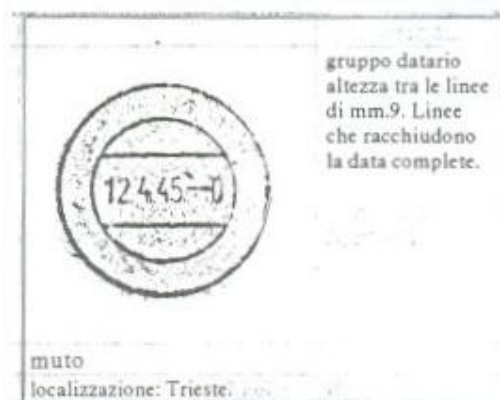
Fig.8- bollo muto della Feldpost tedesca della zona di Adria, localizzato a Trieste.