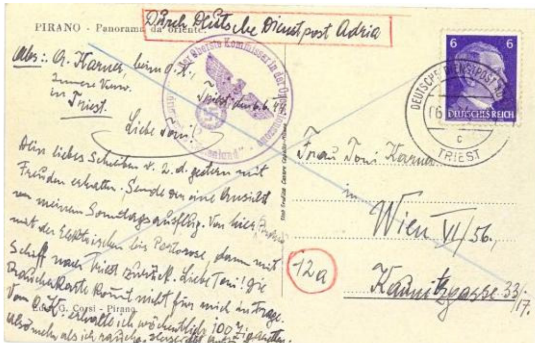
Fig.5 - Cartolina illustrata epistolare da "Deutsche Dienstpost Adria- Triest c – 6.6.44 a Vienna, affrancata con francobollo da 6 p. Rare le cartoline di origine non filatelica.

All'uso della Dienstpost furono anche autorizzati aziende e privati di nazionalità tedesca per l'inoltro di corrispondenze con destinazione in Germania. In questo caso la corrispondenza non godeva di franchigia, ma doveva essere affrancata con le tariffe ed i francobolli tedeschi (lettera : 12 p. - cartolina 6 p. - diritto di raccomandazione 30 p.). (fig.5 - 6):